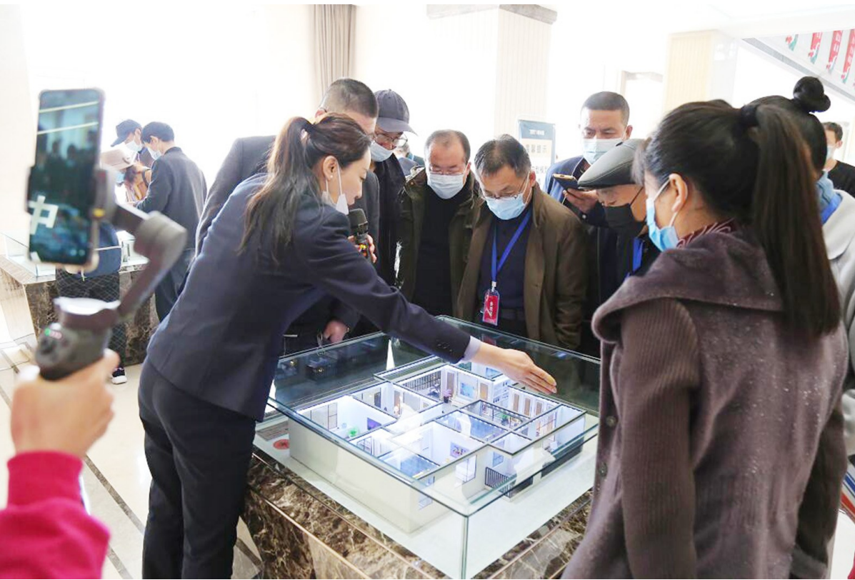
看房团活动现场，工作人员向购房者介绍楼盘模型。

为更好服务广大购房者,今年的看房团仍继续为市民提供免费大巴接送、专业置业顾问讲解等服务。