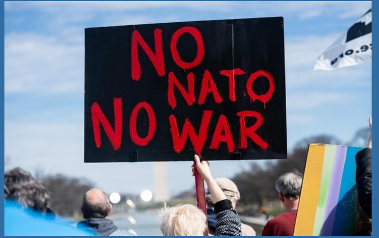
2月19日,在美国首都华盛顿,一名抗议者手举标语在林肯纪念堂前参加反战集会